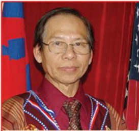
သရဉ်ဝုနာ် ပုဟးစု