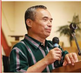
သရဉ်ထံဂုၤ ပုဟးလီၤဆဉ်နီၤသယဲၤ