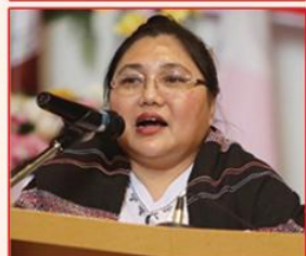
သရဉ်မုဉ်မၤလံအါမုဉ်ဖိ ယွၤဟ့ၢ်ပိညါ KTSC ကိုဉ်