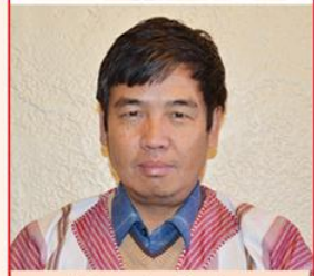
သရဉ်ဒိဉ်လၢကံမုဉ်တ့ဉ် နဲဉ်ရှဉ်သယဲၤ