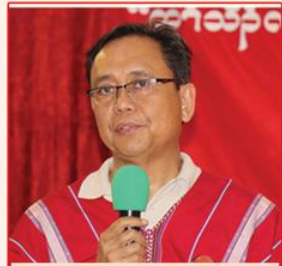
သရဉ်ဒိဉ်ဒီးကထာဉ်လၢကံထူ နဲဉ်ရှဉ်