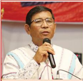
သရဉ်ဒိဉ်ဆဉ်မူဂုံမိဉ် ပုဟးလီၤဆဉ်နီၤ