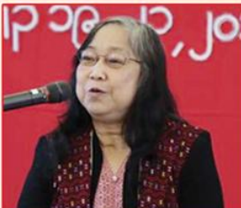
သရဉ်မုဉ်ဆဲးမုဉ်ရှဉ် ယွၤဟ့ၢ်ပိညါ KTSC ကိုဉ်