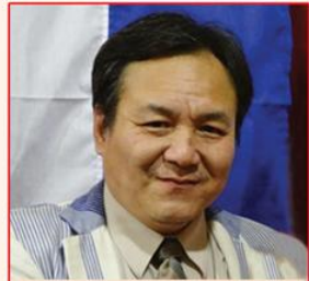
သရဉ်န့ၢ်ထူ ပုၤသမံသမိးစု