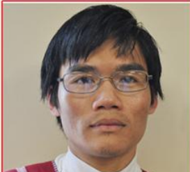
သရဉ်လီၤအဲဉ်ရီလဲ ဝဲၤဒးဒိဉ်