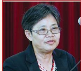
သရဉ်မုဉ်အ့အ့သိဉ် ပုၤသမံသမိးစု